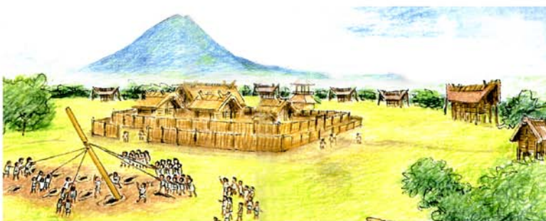
伊勢遺跡の大型建物群

しかしながら、これらの遺跡は約 30 年にわたり、土地開発に伴って少しずつ発掘され、調査確認の後は地下に保存処理されており、その全貌を見ることはできません。