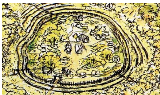
下之郷遺跡の多重環濠